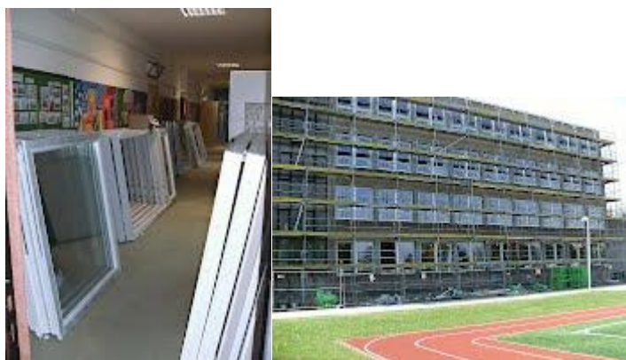
Okna jsou všude.

Blíží se konec prázdnin a tedy i zahájení nového školního roku. Jak jsem již psala, jeho začátek se nám o týden posunul, ale věřte, že ve škole panuje čilý ruch. Pracovníci firem dělají všechno pro to, aby byly práce hotovy dle harmonogramu a všichni jsme se mohli vrátit do naší školy, která zcela změní svůj vzhled.