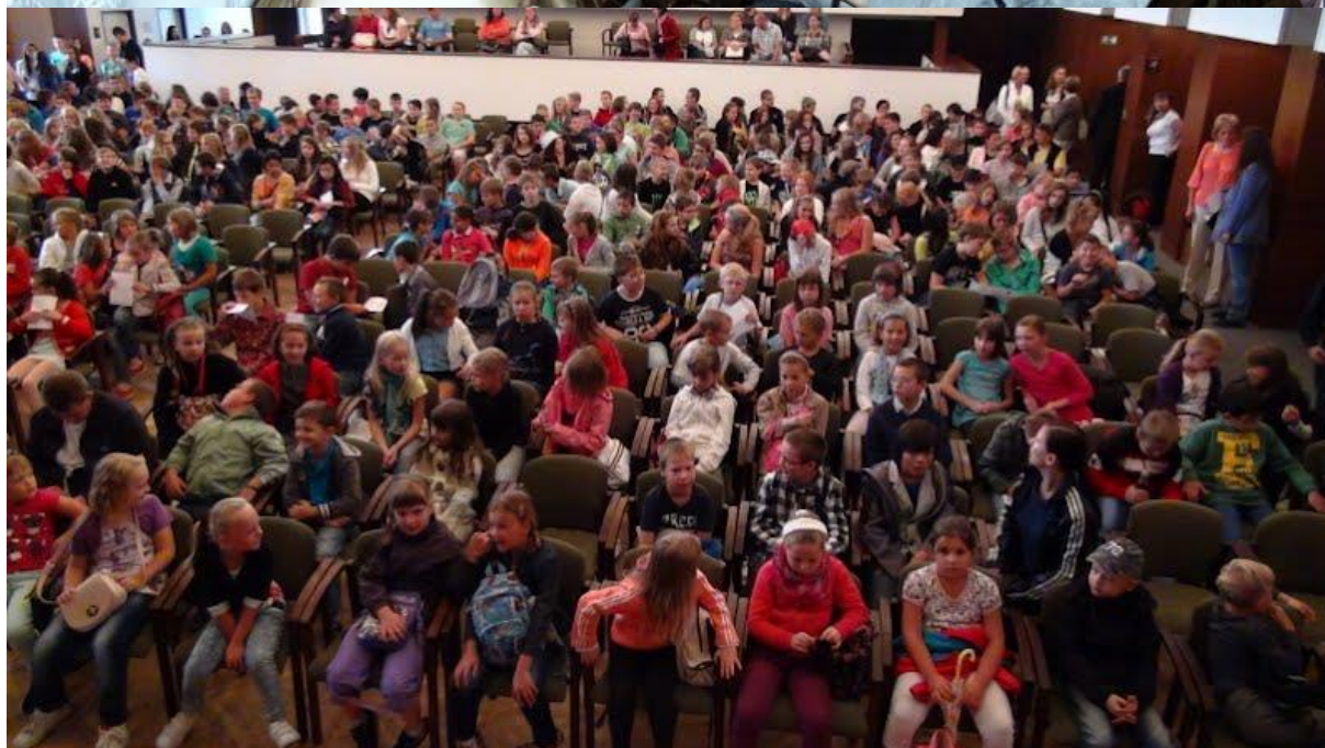
ZAHÁJENÍ V KDK